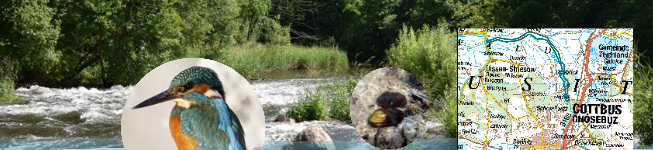
Eisvogel und Bachmuschel