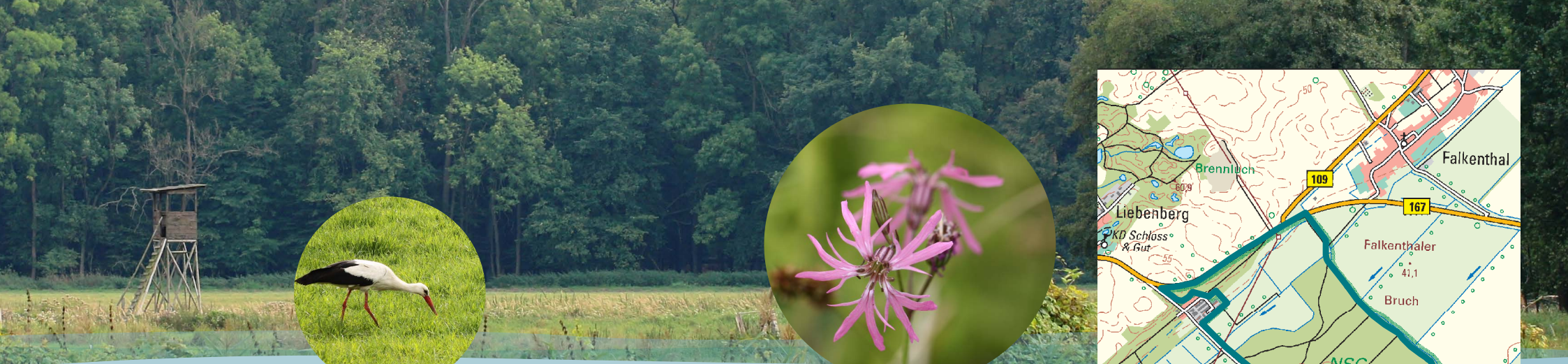
Weißstorch und Kuckucks-Lichtnelke