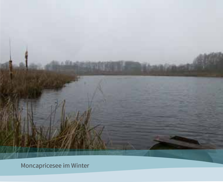
Moncapricesee im Winter