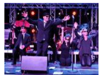
Stadthalle wird Blushochburg für eine Nacht