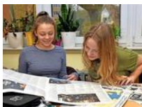
Medienkompetenz wappnet gegen Fake News