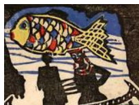
Kunstvolles Dutzend stellt aus