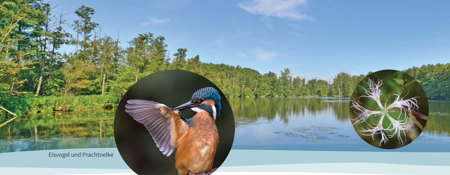
Eisvogel und Prachtnelke