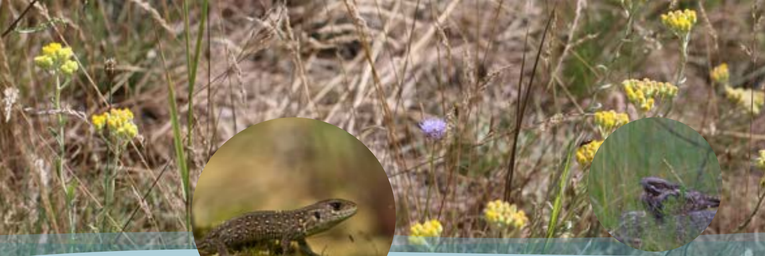
Zauneidechse und Ziegenmelker.