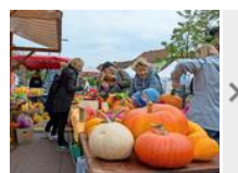
Spaß beim Kürbisfest