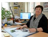
Viele Ziele statt großer Visionen