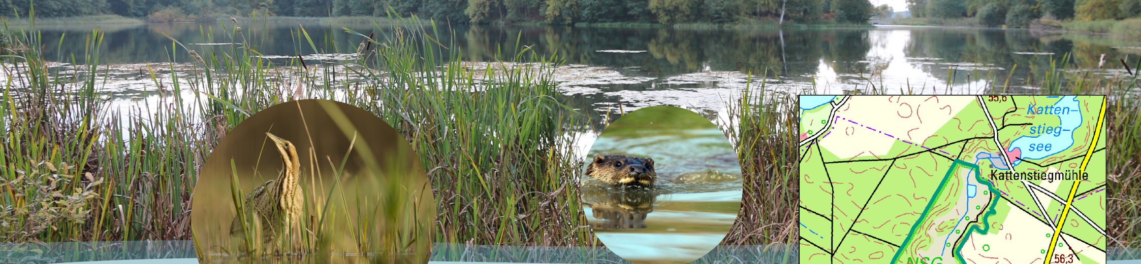
Rohrdommel und Fischotter