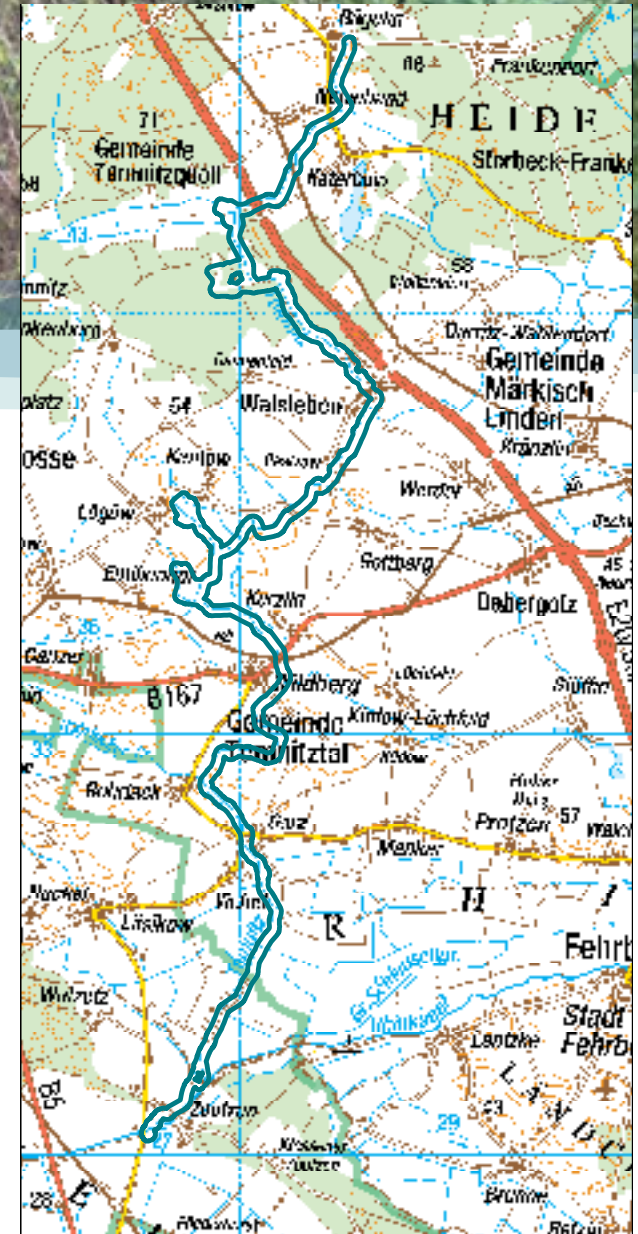
Geobasisdaten: LGB © GeoBasis-DE/LGB, Stand der Daten: 2015, LVE 02/09.

Projektseite: www.natura2000-brandenburg.de