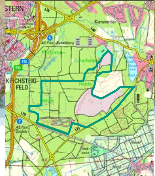
Geobasisdaten: LGB © GeoBasis-DE/LGB, Stand der Daten: 2015, LVE 02/09.

Die digitale Karte finden Sie unter: www.natura2000-brandenburg.de/projektgebiete