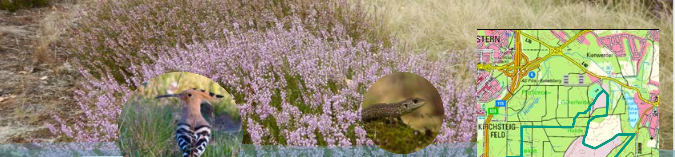
Wiedehopf und Zauneidechse