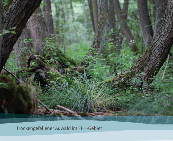
Trockengefallener Auwald im FFH-Gebiet