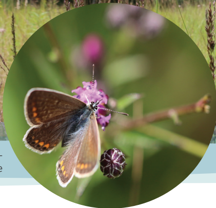
Pfeifengraswiese mit Bläuling auf Färberscharte