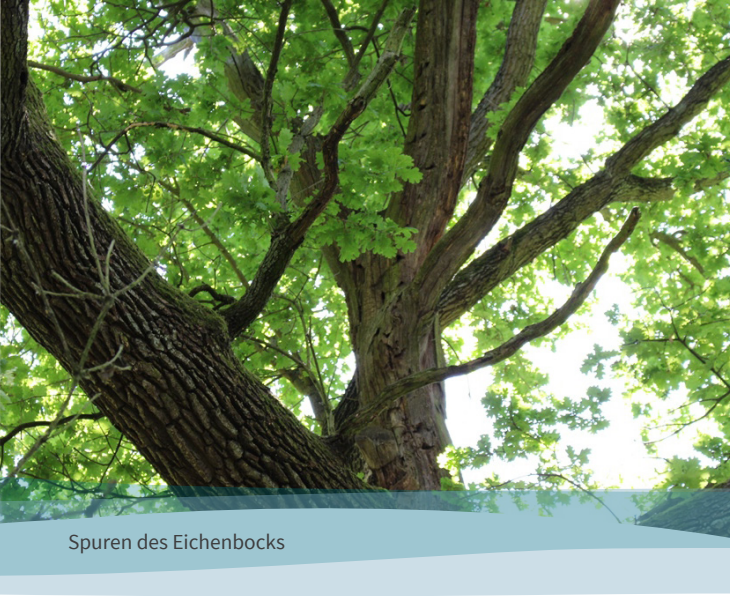
Spuren des Eichenbocks