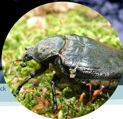
Eremit und Großer Eichenbock