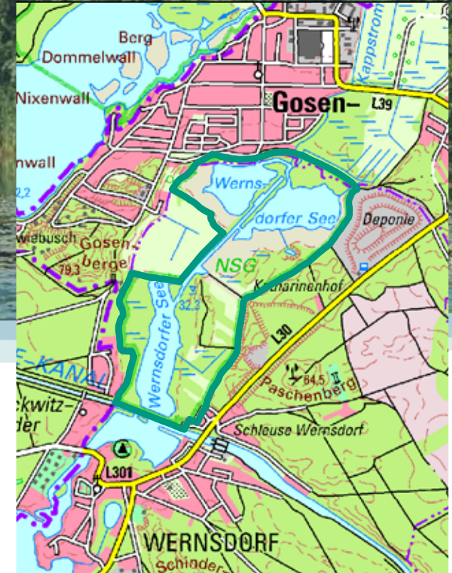
Geobasisdaten: LGB © GeoBasis-DE/LGB, Stand der Daten: 2015, LVE 02/09

Die digitale Karte finden Sie unter: www.natura2000-brandenburg.de/projektgebiete