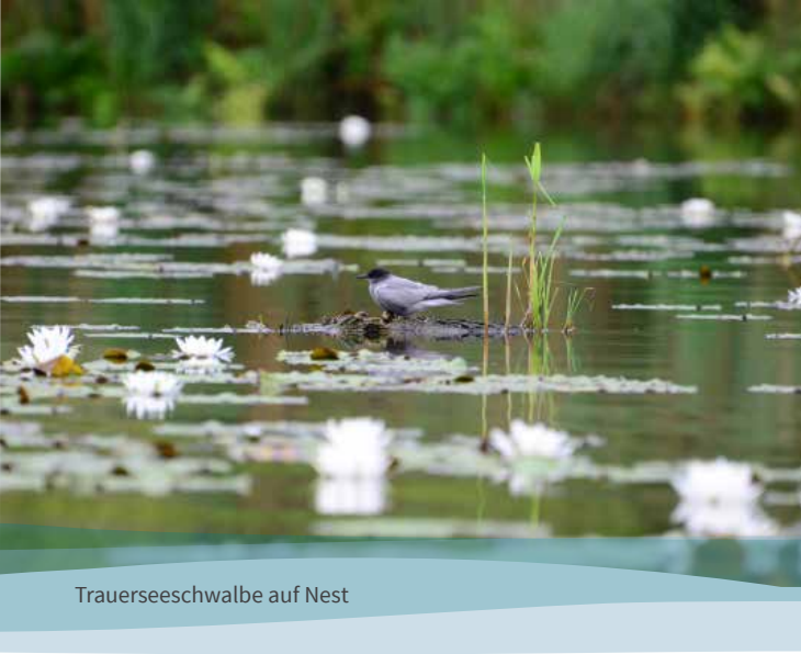
Trauerseeschwalbe auf Nest