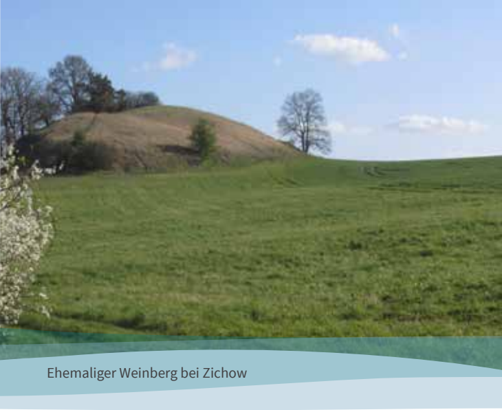
Ehemaliger Weinberg bei Zichow