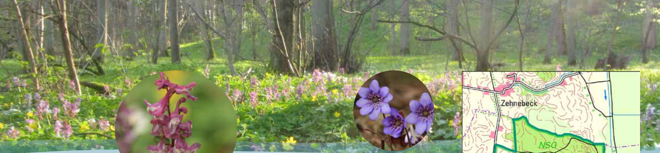
Hohler Lerchensporn und Leberblümchen